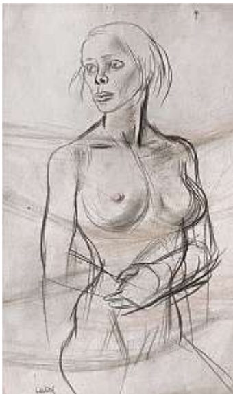
Karl Hubbuch, Dirne, um 1925, Privatsammlung.

Engen. Man darf wohl feststellen, dass das Frauenbild vor 100 Jahren ein anderes war als in den heutigen Zeiten von Gleichberechtigung und #MeToo. Für die das damalige Kunstgeschehen beherrschenden Männer war die Frau ein höchst zweideutiges Wesen zwischen Verführerin und Heiliger. Eine Frau, die den gesellschaftlichen Normen nicht entsprach, war dem Mann und Künstler, der von den gesellschaftlichen Rollenbildern profitierte, ein Stein des Anstoßes, Faszinosum und Schreckbild zugleich.