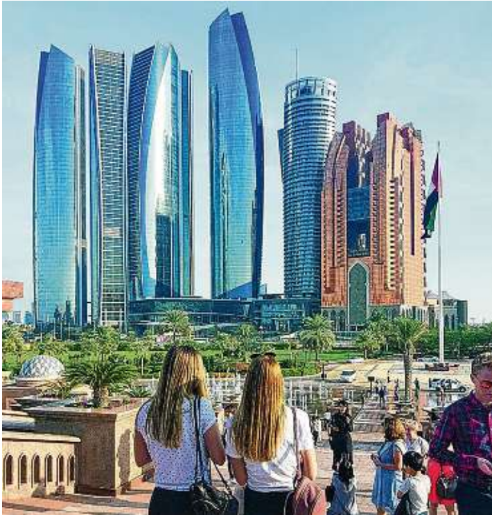
Eine beeindruckende, moderne Skyline: Abu Dhabi.