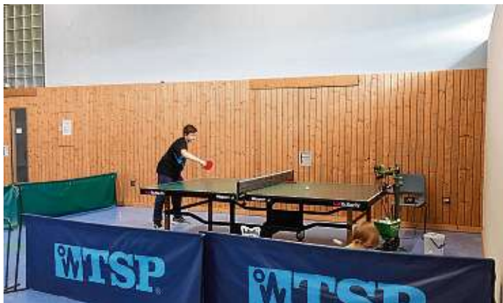
Eine gute Trainingsmöglichkeit bietet beim TTC Engen/Aach die Tischtennis-Ballwurfmaschine.